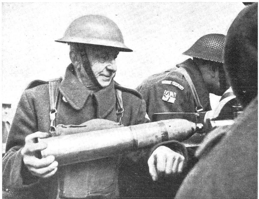
Sowohl hinsichtlich Bekleidung wie auch persönlicher Ausrüstung unterscheidet sich die englische Heimwehr in nichts vor der regulären Armee; lediglich das «Home Guards» auf den Achselklappen verrät, daß es sich hier um «Ortswehr» handelt.

Heimwehren besonders für den Ortskampf ausgebildet und erhalten intensive Geländekenntnis. Ferner müssen