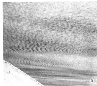
Cirro-Cumulus oder feine Schäfchen.