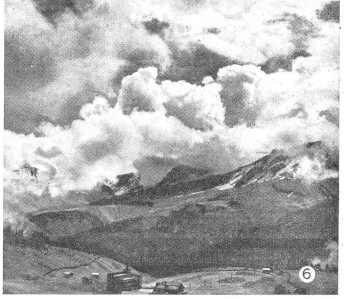
Cumulus-Nimbus- oder Gewitterwolken.