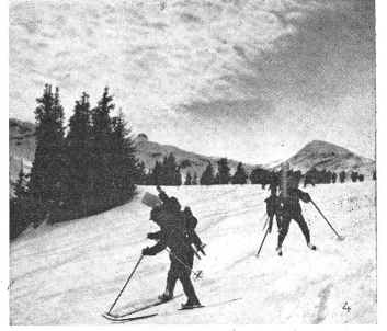
Alto-Stratus- oder hohe Schichtwolken. (Zens.-Nr. VI S 11760.)