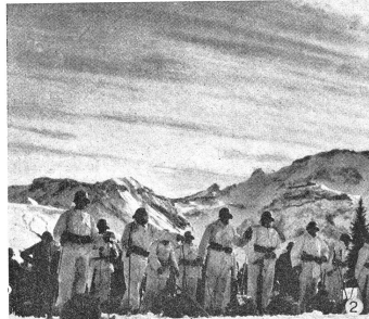
Cirro-Stratus- oder Schleierwolken. (Zens.-Nr. VI S 11761.)