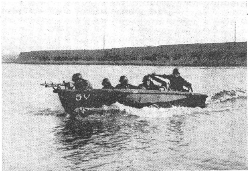
Sturmboote im Kampf an der Ostfront: Die Forcierung der mächtigen Flüsse Rußlands gelang in vielen Fällen erst mit dem Einsatz der schnellen Sturmboote.

Seitdem ist so mancher Fluß im Westen und Osten von deutschen Sturmbooten überquert worden, war es doch nicht zuletzt ihnen zu danken, daß die «Panzersprünge» über die Somme, Aisne und Loire, über den Njemen, Njepr und Kuban so glückten. Selbst auf das offene Meer trauten sie sich hinaus. Die griechischen Inseln Samothrake und Lemnos halfen sie ebenso gut zu erobern wie die baltischen Inseln Moon, Dagoe und Oesel, wie die Felseilande am Rande des Schwarzen Meeres. Schienen die Wasserbreite und die Wellenstärke ihre Kraft zu übersteigen, so nahmen landesübliche See-