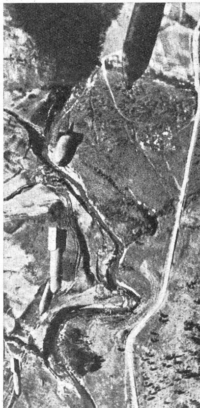
Reihenabwurf von Fliegerbomben.

Am 7. September 1940, als der Rundfunk erklärte: «In dieser Stunde führt die deutsche Luftwaffe ihren härtesten Schlag gegen das Herz des Feindes», wüteten bereits vor Mitternacht in London acht gewaltige Brände, die je von mehr als hundert Motorpumpen bekämpft werden mußten. Brandtechnisch waren die Brände «außer Kontrolle» und breiteten sich ungehindert über ein riesiges Gebiet aus. Im Arsenal von Woolwich kam es zu einem Großfeuer, zu dessen Bekämpfung 200 Motorpumpen eingesetzt wurden. Es handelte sich hierbei um das größte Militärziel, das London bieten konnte. Die Feuerwehr gab es schließlich auf, die Flammen zu löschen, und beschäftigte sich mit den Pionieren nur damit, unter dem ständigen Bombenhagel Munitionskisten und Lager mit Nitro-Glyzerin herauszuschaffen. In den Hafenanlagen von Surrey am rechten Themseufer kam es zu dem bisher in der Geschichte Englands ausgedehntesten Großfeuer, gegen das 348 Motorpumpen eingesetzt wurden. Die Versuche der Feuerlöschboote, die riesigen Holzlager im Hafen zu retten, waren erfolglos, da die Wasserstrahlen der