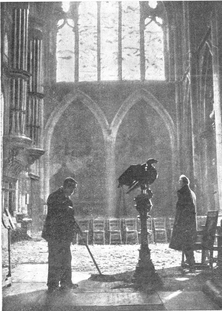
Londoner Kirche nach einem Fliegerangriff während der Luftschlacht um England.

mission insgesamt 50 000 Sprengbomben im Gesamtgewicht von 7500 Tonnen abgeworfen worden. Die Zahl der Brandbomben ließ sich nicht feststellen, dürfte aber weit über einer Million liegen.