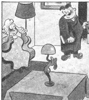
„Ich muss gehen, sonst komme ich zu spät zur Chorprobe.“ — „Nimm Dich in Acht, es weht ein rechter Grippewind.“

(EHO.) Wir wissen im Grunde recht wenig über den nordamerikanischen Kontinent, über das Werden und Wesen der U.S.A., über die soziale Gliederung ihrer Bevölkerung und über ihre Wirtschaftsverhältnisse. Es sei denn, man hätte sich während der Schule oder des Studiums auf Nordamerika spezialisiert. Dies dürfte aber beim größten Teil unseres Volkes kaum zutreffen. Man sagt, daß Amerika mitgeholfen habe, den ersten Weltkrieg zugunsten der Entente zu entscheiden und nun ist bald ein Jahr verflossen, seit die U.S.A. zum zweitenmal in das weitgespannte Kriegsgeschehen eingegriffen haben. Deshalb verdient der ungemein tätige Europa-Verlag unsere Anerkennung, daß er sich die Herausgabe einer «Geschichte der U.S.A.» vorgenommen hat. Auf 175 Seiten gibt der Verfasser Allan Nevins einen kurzen Ueberblick über Amerikas Geschichte. In großen Zügen wird das Wachsen der Vereinigten Staaten geschildert, wobei vor allem auf die soziale Geschichte besonderer Nachdruck gelegt wird. Nevins Werk ist denkbar gut geeignet, uns das Wesen und Werden der U.S.A. näherzubringen und wird des niedrigen Preises wegen (kart. Fr. 5.—) wohl einer großen Leserschaft als willkommene Aufklärung dienen.