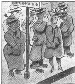
„Hören Sie, wie alles um uns herum hustet; da werden wieder viele bei der Probe fehlen.“