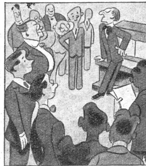
„Ich freue mich, dass wir vollzählig versammelt sind und hoffentlich alle gut bei Stimme. Haben Sie meinen Rat befolgt?“