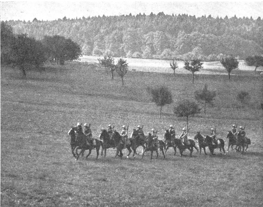
Kavallerie-Schützengruppe im Vorgehen. (Z.-Nr. VI R 11894.)

Die Zusammenstellung der Kavallerieverbände variiert naturgemäß je nach Gebiet der Kampfhandlung. Jeder deutschen Infanteriedivision ist normalerweise eine Aufklärungsabteilung angegliedert, welche über wenigstens eine Reiterschwadron verfügt. Die Zusammenstellung dieser A.Abt. ändert aber häufig, d. h. je nach bevorstehen-