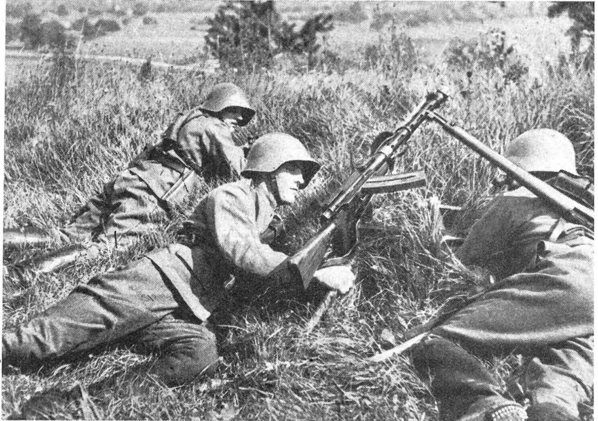
Kavallerie-Lmg.-Trupp beim Bezug einer Feuerstellung. (Z.-Nr. VI R 11865.)

mee durch das Zupacken der Reiter gesichert. Wem ist der Erfolg zu verdanken? Dem alten Reitergeist, der nur eine Parole kennt: «Drauf und durch!» (DKW.).