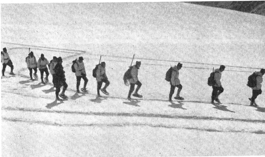
Kolonnenmarsch auf Schneereifen. (Zens.-Nr. VI H 11965.)

Diese Ausbildungsabschnitte bilden nur einen kleinen Teil der Programmpunkte eines B-Kurses. Sie bilden aber