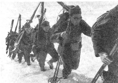
Aufstieg in der Falllinie. (Zens.-Nr. VI H 11961.)

das An- und Abschnallen der Reifen oder Bretter muß mühelos geschehen. Wie viele Wehrmänner werden im Ernstfall im Winter ohne Ski einrücken und werden dann froh sein, sich auf diese Art und Weise durch tiefen Schnee fortbewegen zu können. Denken wir nur an den großen Nachschub, der oft auf schwierigen Wegen zur Front getragen werden muß! Hier gilt das Prinzip: Nicht zu langer Schritt, leicht eingepreßte Fußspitze (Parallelstellung in der Längsachse), Kolonne im Schritt, Schritte zählen und sehr fleißig abwechseln. Bei genügender Breite hinterlassen die Spuren dieser Fortbewegungsmittel das vorbereitete Trasse für nachfolgende Nachschub-Schliffen-Kolonnen.