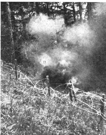
... dreckspritzend und Erdfontänen hochwerfend... (Z.-Nr. A/N/155.)

Handgranate! Mehr instinktiv als überlegt wirble ich meinen Körper hoch und lasse mich zwei Meter rechts in einen wie für mich dahin geschossenen, pfützenähnlichen Trichter fallen, als es auch schon kracht! Links von mir, in etwa zehn Meter Entfernung, schreit einer auf, tierisch, schrill. Armer Kamerad, dich hat's erwischt! Wieder kommt er hoch, der andere, aber diesmal hab ich ihn... wie auf die Sekundenscheibe ist das... Kopfschuß, er fällt mit dem Schwung des Wurfes vornüber und liegt still auf dem Gesicht, als es wieder kracht. Diesmal schreit bei uns keiner mehr, sie haben aufgepaßt! Etwa fünf Meter vor mir sehe ich einen tieferen Trichter, der mir beste Deckung gewähren