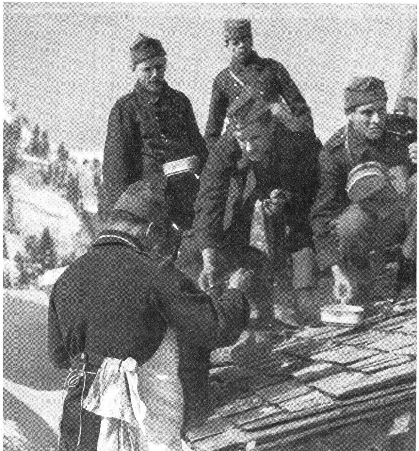
Heißer Tee kann gefaßt werden. (Z.-Nr. VI B 9588.)

Wenn das Schwitzen auch ein sehr wirksames Mittel gegen das «Fieber» der Anstrengung ist, so kann es doch nachteilige Folgen nach sich ziehen; reichliches Schwit-