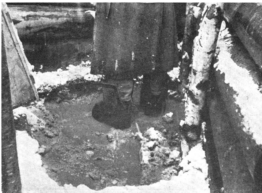
Tauwetter im Schützengraben.

Die Waffen haben Hemmungen, weil Öle und Fette für die beweglichen Teile festfrieren. Die Batterien der Fernsprechapparate und der Funkgeräte