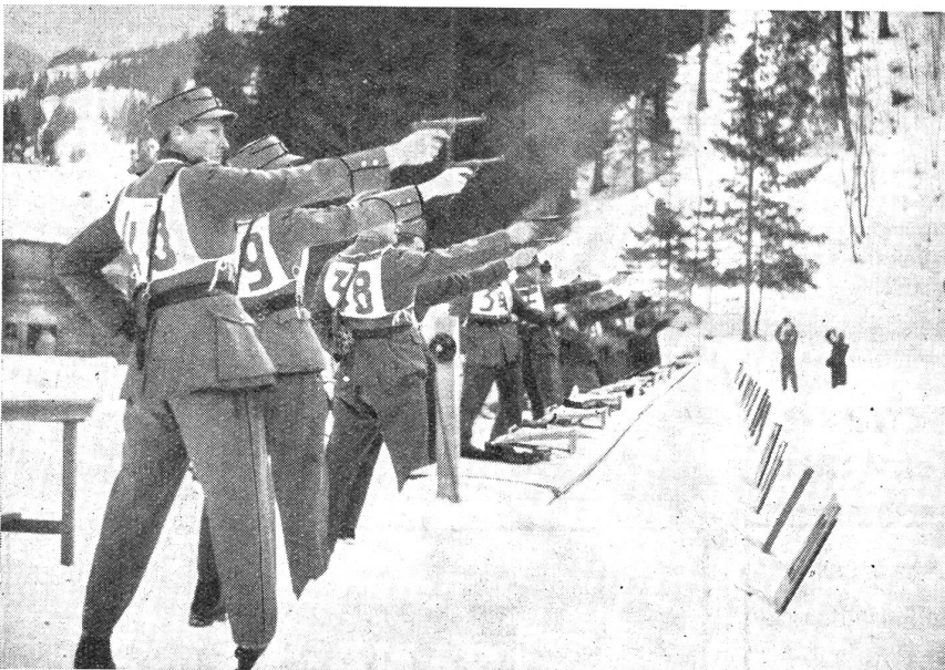
Pistolenschießen. (Terr.Kdo. 11/3243.)