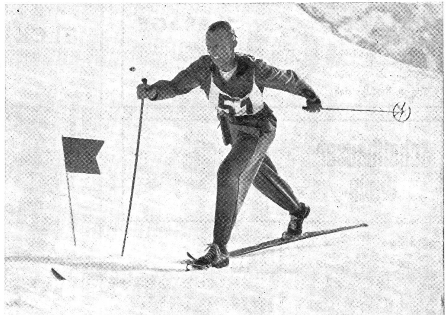
Auf der Strecke im Langlauf. (Zensur-Nr. VI Vi 12167.)

schafts-Dreikampf oder an den Patrouillenläufen starten, Gelegenheit, auch an diesem Wettbewerb teilzunehmen. Das würde auch zu einer Verkürzung der Veranstaltungsdauer führen und ließe die Frage wiederum offen, ob nicht der leichte und schwere Patrouillenlauf von einander getrennt, resp. an zwei verschiedenen Tagen ausgetragen werden könnten. Die Wettbewerbe der Fünf- und Vierkämpfer ließen sich be-