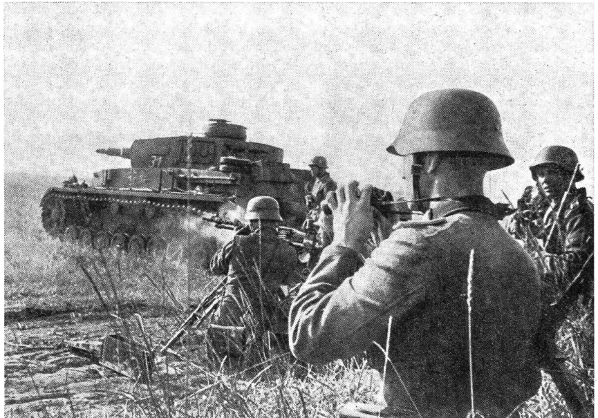
Schwerer Panzer und Panzergrenadiere im sprungweisen wechselseitigen Vorgehen.

Die letzten Ereignisse im Kriegsgeschehen beweisen mit Nachdruck die Feststellung, daß ein Angreifer bei seinen Aktionen nach Möglichkeit den Weg des geringsten Widerstandes einzuschlagen sucht, um damit den Gegner bereits in den ersten Phasen des Krieges vernichtend schlagen zu können. Inwieweit die Theorie des geringsten Widerstandes überhaupt anwendbar ist, entscheidet wohl die militärische und moralische Bereitschaft des anzugreifenden «Opfers». Ist der zukünftige Gegner durch die Propaganda, durch Zersetzung und Spionage