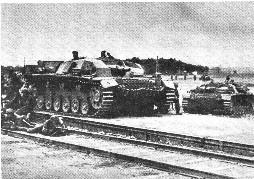
Deutsche Sturmgeschütze (turmlose Panzer) als Begleitartillerie.

Einsatz im Verhältnis zum erreichten Erfolg! Auch der Angriff gegen Jugoslawien war gewissermaßen ad hoc organisiert, da man deutscherseits ja gar nicht damit rechnete, mit diesem Staat in den Krieg zu kommen. Völlige Bereitschaft ließ aber diese Operationen gelingen, während serbischerseits tiefgehende Desorganisation jede planmäßige Verteidigung verunmöglichte. Um die Strategie des Ueberfalls mit Erfolg durchzuführen, wird der Angreifer alle seine Angriffsvorbereitungen verschleiern und seine Pläne geheimhalten. Der Anzugreifende wird eingeschläfert, um nachher desto gründlicher überrascht zu werden. Die Operationen gegen die Alliierten im Westen 1940 und gegen Rußland 1941 sind in dieser Beziehung Musterbeispiele größter strategischer «Tarnung». In der Regel wurden die ersten Ausgangsräume nahezu kampflos besetzt und in ihnen sofort der Nachschub durchgeschleust, um den begonnenen Angriff mit Wucht und Schwung fortsetzen zu können. Luftlandetruppen und Fallschirmjäger wurden im feindlichen Hinterland, an strategisch wichtigen Punkten, abgesetzt, mit dem Auftrag, diese Punkte zu besetzen und zu halten, bis die eigene Angriffsspitze sich mit ihnen vereinigen konnte. Ferner wird danach getrachtet, Objekte von lebenswichtiger Bedeutung (Elektrizitätswerke, industrielle Unternehmen usw.) möglichst rasch und unversehrt in die eigenen Hände zu bringen, um sie nach erfolgter Okkupation des Landes sofort wieder in Betrieb zu setzen. Die Voraus-