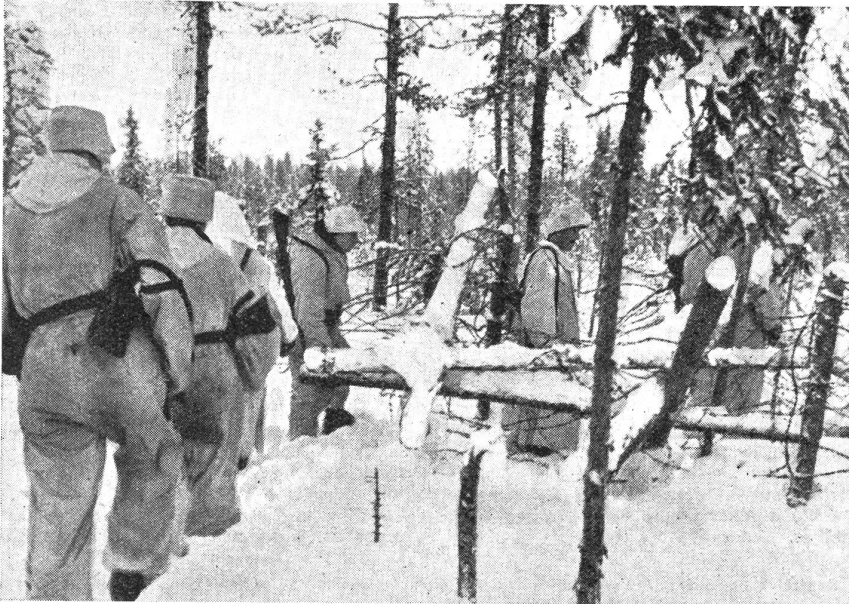
... und passiert kurz darauf die im lichten Wald ausgelegte Drahtsperr.

Es geht schnell, bald hocken wir wieder bei dem einen der beiden Sicherungsmaschinengewehre. Keiner fehlt. Eine Pause, dann ein zweites Mal an den Graben, diesmal weiter links, denn wir haben noch Magazine für Maschinenpistolen und auch Handgranaten, die einem guten Zweck zugeführt werden können. Wieder