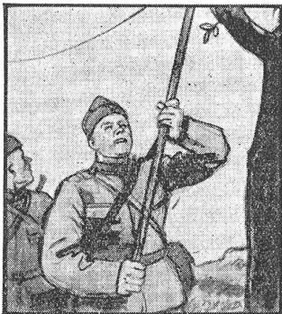
„I alle Regimänte, bi jeder Kompanie, müend dere Sapermente zum telefönle si.“