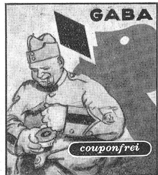
Deshalb gehören Gaba in jedes Soldatenpäckli. Gaba schicken — Gaba schützt.