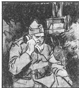
„Dü Poschte isch gar wichtig, wenn's de is Träffe goht. Dass me's Kommando richtig zäh Schtunde wit versteht.“