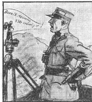
Aber eine klare, starke Stimme gehört immer dazu, beim Telefonieren wie beim Kommandieren.