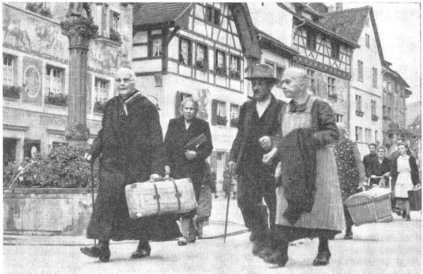
Bei einer Kriegsmobilmachung wird nicht evakuiert. Die Bevölkerung darf nicht abwandern wie es dieses Bild zeigt. (15702/11.)

Bedenkt man, daß es Ter.Kreise gibt, die mehrere hundert O.W. aufweisen, so begreift man auch, daß die Ter.-Kdt. ganz auf die Reg.Kdt. angewiesen waren und dadurch persönlich beinahe gar keine direkte Einwirkung auf die Ausbildung der O.W. haben konnten. Da die Reg.Kdt. seit vielen Jah-