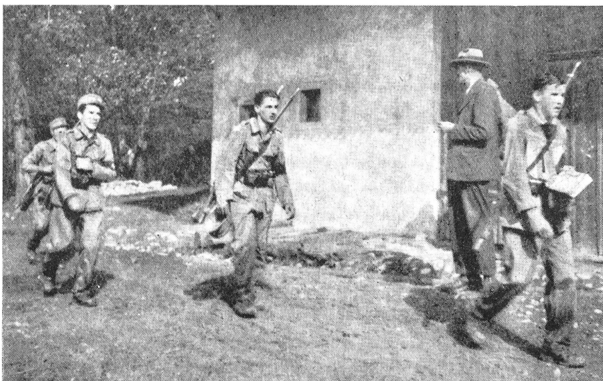
Junge O.W.Soldaten bei einem Orientierungslauf. (15702/9.)

Im Jahre 1942 bestanden die Reg.- und O.W.Kdt. wieder einen dreitägigen Ausbildungskurs. Nach diesem Kurse hatten die O.W.Kdt. unter Aufsicht der Rg.Kdt. in den O.W. die Handhabung der Waffe, das Einsetzen der Tankbarrikaden, den Wachtdienst usw. zu üben und speziell die Einsatzaufgaben durchzuexerzieren. Der Wunsch nach vermehrten Uebungen mit der Truppe zwecks praktischer Erprobung des Gelernten ging leider nicht in Erfüllung, da man allgemein die O.W. nicht anerkannte. Da und dort zeigten sich sogar deutlich Abneigungen gegen die O.W., und man konnte öfters kritische Worte hören über den ungenügenden Ausbildungsstand und die Verwendung derselben. Man äußerte ziemlich laut, daß die O.W.-Leute ja nicht einmal laden und entladen können. Bei dieser Beurteilung vergaß man aber voll und ganz, daß die meisten O.W.-Leute nie eine Rekrutenschule bestanden haben, und daß es sogar sehr viele O.W.Kdt. gibt, welche nie Soldat waren. Man vergaß auch, daß die O.W.-Leute bisher nie Manipulierpatronen oder blinde Patronen zur Verfügung hatten, um das Laden und das Entladen mit Patronen üben zu können. Wenn dann da und dort in einer O.W. das Laden und Entladen mit scharfer Munition auf dem Turnplatz in Gegenwart einer Schar Kinder geübt wurde, so stellten die Kritiker das gefährliche Spielen mit scharfer Munition fest und waren der