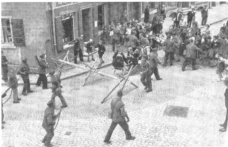
Jede Ortswehr hat eine einsetzende Evakuierung und Abwanderung zu verhindern. Hier schreitet die O.W. ein, schließt alle Dorfausgänge durch Barrikaden ab und bewacht dieselben. Im Dorf und in den Quartieren trifft man dann in solchen Lagen O.W.Ueberwachungspatrouillen an. (15702/5.)

Die Zahl der Ausbildungssof. reichte aber nicht aus, um die Ausbildung in allen O.W. zu leiten, so daß diese Of. auch auf das Können der O.W.Kdt. und O.W.Gr. angewiesen waren. Speziell das Können der O.W.Gr. war sehr bescheiden, da diese bisher nie eine besondere Grf.-Ausbildung er-