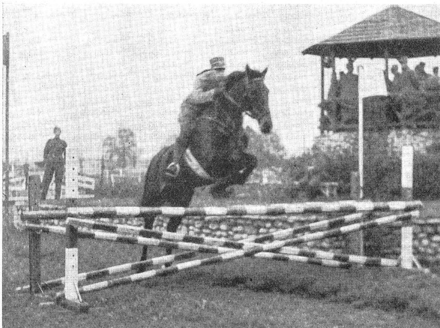
Reiten im Städte-Wettkampf im Modernen Fünfkampf in Thun. Hindernisspringen. (VI Hg. 15520.) Phot. E. Geißbühler, Winterthur.

Mannschaften: 1. Bern I (Fw. Weber, Oblt. Schriber, Oblt. Homberger) 148 P. 2. Zürich I (Oblt. Zimmermann, Lt. Keller, Oblt. Alfons Schoch) 205 P. 3. Thun (Hptm. Grundbacher, Oblt. Mosimann, Oblt. Diemi) 218 P. 4. Bern II (Fw. Röhliberger, Lt. Rufer, Oblt. König) 249 P. 5. St. Gallen 265 P. 6. Baden 281 P. 7. Fünfkampfsolisten 292 P. 8. Bern III 309 P. 9. Zürich II 373 P.