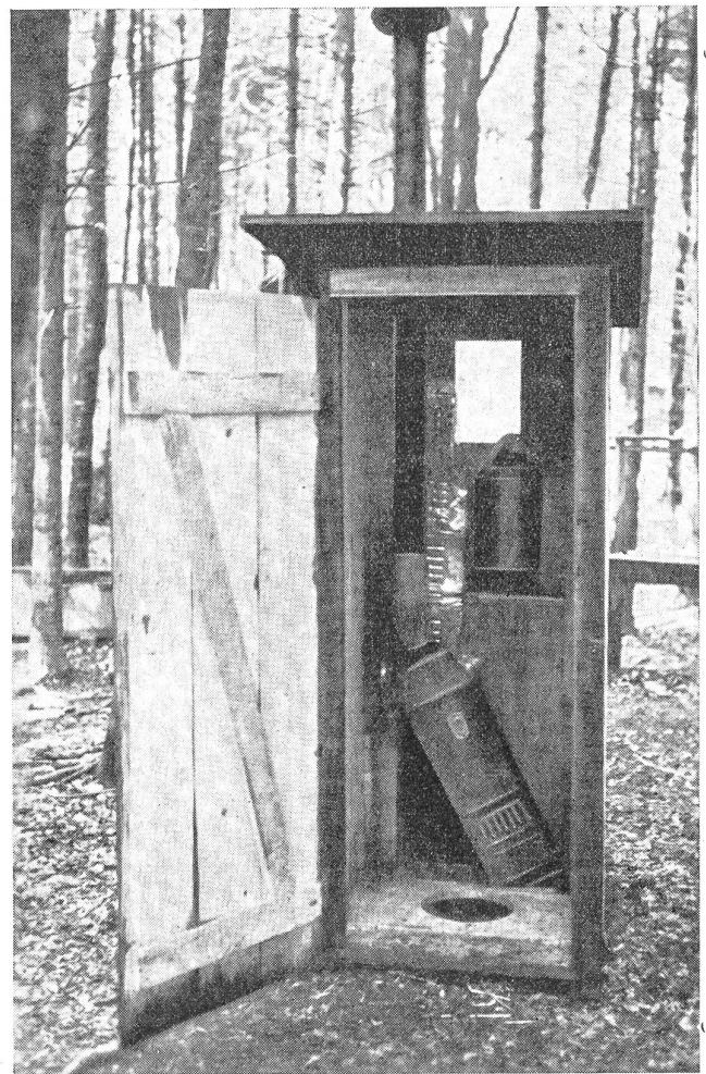
(VI Hg. 15582)