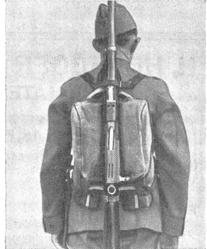
(VI 10598 SN)