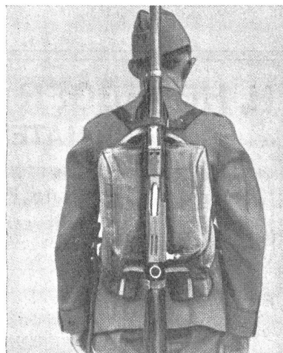
(VI 10598 SN)

Die bisherigen Erfahrungen an Wettkämpfen haben gezeigt, daß mancher an sich guten und durchaus leistungsfähigen Patrouille der Erfolg deswegen geschmälert oder zunichte gemacht wurde, weil die Sturmpackung unter den Anstrengungen des Kampfes zu schlankern begann und den Mann wesentlich behinderte. Nunmehr hat der Zürcher Mitr. Wm. Robert Hogg einen außerordentlich einfachen aber vorteilhaften Halter für die Sturmpackung konstruiert, der den Karabiner immer in der gleichen Lage hält und ein schnelles Bereitstellen beim Schießen garantiert. Die neue Konstruktion hat sich an verschiedenen Wettkämpfen bereits sehr gut eingeführt und sie wird von Fachleuten sehr warm empfohlen. Sie wird auch den Teilnehmern am bevorstehenden Militärwettermarsch Frauenfeld gute Dienste leisten. (Siehe Inserat auf dieser Seite.)