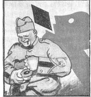
Deshalb gehören Gaba in jedes Soldatenpäckli. Gaba schicken — Gaba schützt.