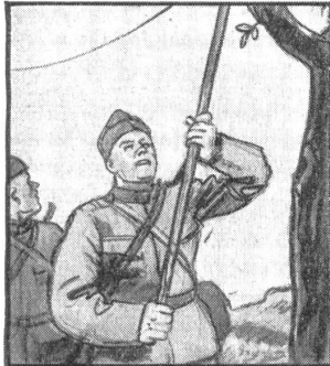
„I alle Regimänte, bi jeder Kompanie, müend dere Sapermente zum telefonle si.“

Die preußische Provinz Schlesien, die 476 000 Quadratkilometer umfaßt und in der 7 460 000 Menschen leben, ist zum Kriegsschauplatz geworden. In dieser Provinz, vor allem in ihren östlichen Teilen, liegen reiche Schätze an Kohlen und Eisenerzen im Boden. Aufbauend auf diesen Naturgütern ist da schon früh eine ausgedehnte Eisen- und Kohlenindustrie entstanden, die an Wichtigkeit derjenigen des Ruhrgebietes nahekommt. Die Bedeutung Schlesiens als Rüstungsarsenal Deutschlands ist gerade in der letzten Zeit gewaltig angestiegen. Da die Industrien des Rhein-