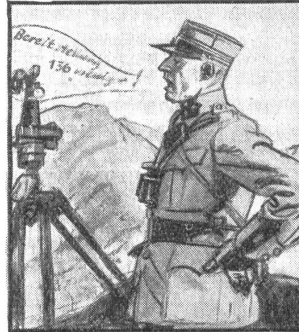
Aber eine klare, starke Stimme gehört immer dazu, beim Telefonieren wie beim Kommandieren.