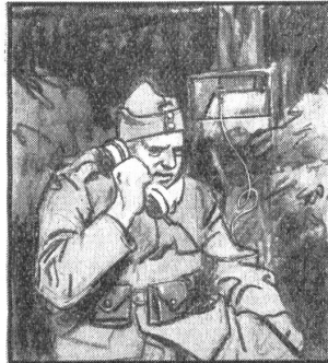
„Dü Poschte isch gar wichtig, wenn's de is Trüffe goht. Dass me's Kommando richtig züh Schtunde wit versteht.“