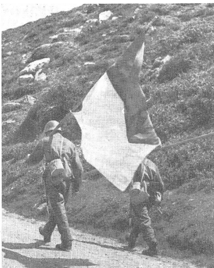
Die vordersten Truppenelemente tragen immer rote, weiße Fahnen mit sich.

Besondere Bestimmungen sind zu beachten beim Ueberschießen von Bahnanlagen . Grundsätzlich ist das Ueberschießen derselben verboten. Ausnahmen bedürfen des Einverständnisses der Bahnbehörde. Erstens muß dabei die absolute Sicherheit beim Ueberschießen ausgewiesen werden können. Zweitens müssen die Einschränkungen, die die Bahnverwaltung fordert, berücksichtigt werden; es handelt sich meist um Limitierung der Schießzeiten, wobei während Zugdurchfahrten nicht geschossen werden darf.