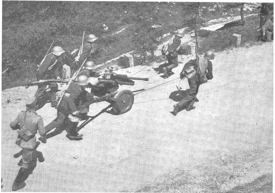
Stellungsbezug einer Ik. im Rahmen eines kombinierten Scharfschießens: ein Sicherheitsoffizier überwacht die Arbeit der Mannschaft.

Handgranaten dürfen unter keinen Umständen über vor dem Werfenden sich befindende Leute geworfen werden. Analoge Uebungen sind auch mit blinden Modellen und Wurfkörpern zu unterlassen.