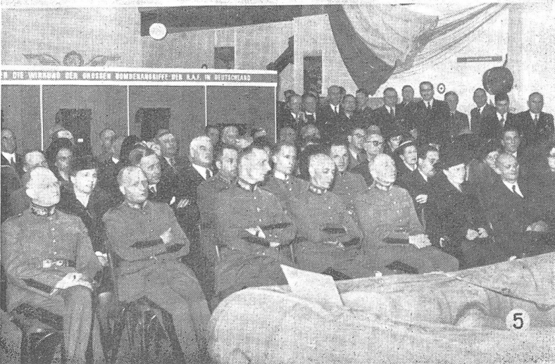
① Luftmarschall Sir Arthur Coningham, der zur Zeit in der Schweiz weilt, eröffnete die Ausstellung. Ihm wurde 1943 der Oberbefehl über sämtliche Flugwaffeneinheiten Englands und Amerikas für die Gebiete Nordwestafrika, Sizilien und Italien übertragen, und die Erfolge der Alliierten stellen seinen Fähigkeiten ein glänzendes Zeugnis aus.