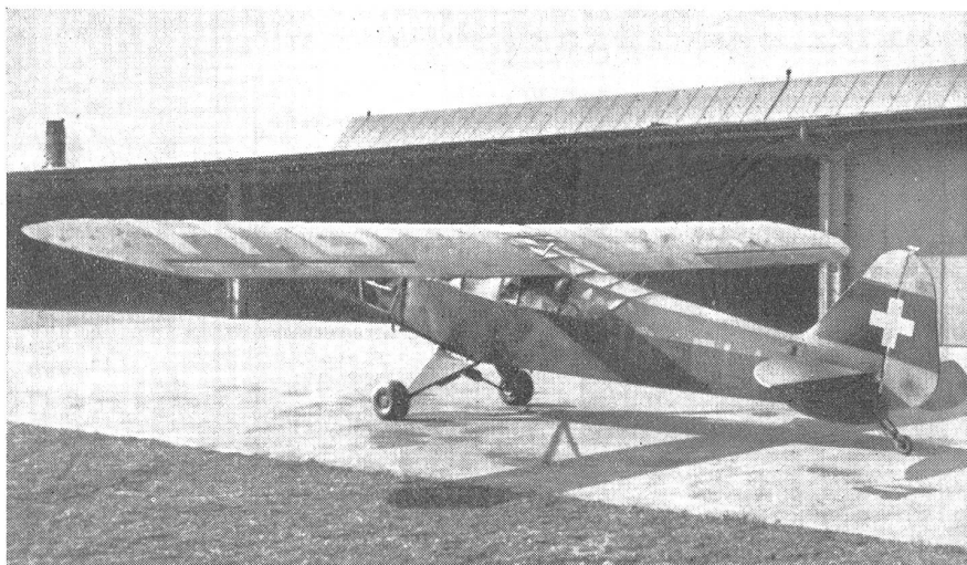
Piper-Grasshopper HB-ELI der Sektion Zürich des Aeroclubs der Schweiz. Eine zweite Maschine der gleichen Type befindet sich zurzeit in Ueberholung und dürfte demnächst in den Flugbetrieb der Motorfluggruppe der Sektion Zürich des Ae. C. S. zu Schulflugzwecken eingesetzt werden.

Der Brennstoffverbrauch stellt sich auf nur 16,6 l pro Flugstunde, d. h.