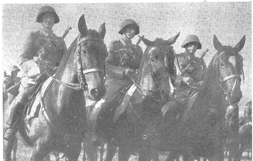
Patrouillenritt. Sieger: Kavallerie-Verein Wynental II.

Dabei spielt bei derartigen Veranstaltungen nicht etwa die materielle Unterstützung die erste Rolle, sondern es kommt auf die Bereitschaft der zivilen Gesellschaften oder Vereinigungen militärischen Charakters an. Die Kavallerie nimmt hier eine beneidenswerte Sonderstellung ein, kann sie doch jederzeit auf die Gefolgschaft der zivilen Kavallerie-Reitvereine, sowie auf deren Mitglieder zählen. Die Aarauer Reiter-Mehrkämpfe wären denn auch ohne den Zentralschweizerischen Kavallerieverein mit