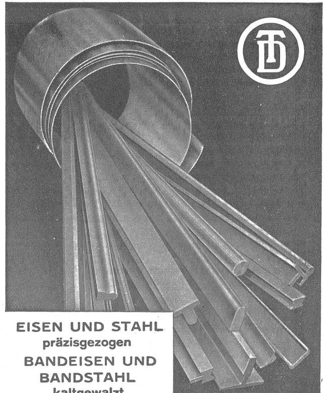
EISEN UND STAHL präziszugezogen BANDEISEN UND BANDSTAHL kaltgewalzt