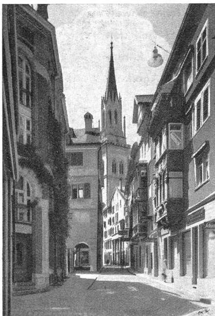
Kugellgasse mit St. Laurenzkirche