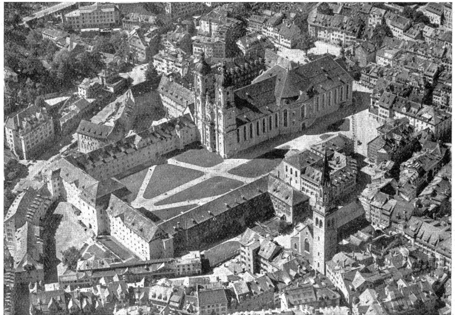
Flugaufnahme St. Gallen, Kathedrale, Regierungsgebäude und St. Laurentzkirche

Als die Stickereiindustrie in höchster Entfaltung stand — es war dies in den achtziger und neunziger Jahren des 19. Jahrhunderts — entstanden jene Geschäftsquartiere, in denen sich jener Geist zu äußern begann, den man als st.-gallischen Amerikanismus bezeichnen darf; stand doch unsere Landesindustrie auf Wohl und Wehe in engstem