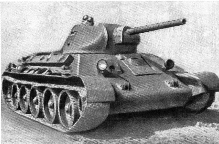
Russischer Panzerwagen T 34, ca. 40 Tonnen, 85-mm-Kanone

Um sein Ziel möglichst rasch zu erreichen, wird der Gegner nach starken Fliegerangriffen und Beschuß mit Fernwaffen, nicht nur Luftlandetruppen, son-