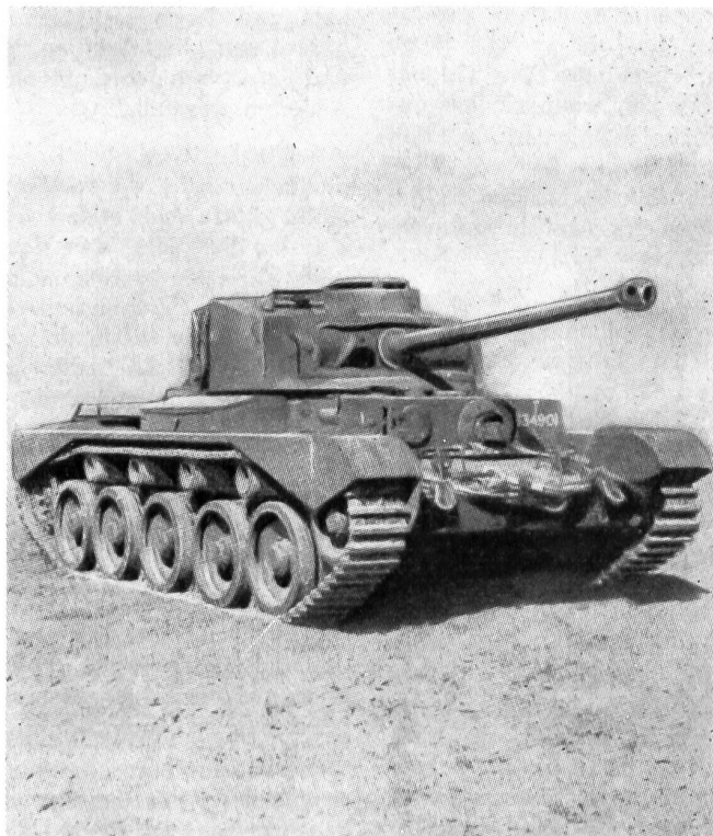
Englischer Panzerwagen «Comet», ca. 45 Tonnen, 90-mm-Kanone

Trotzdem wir im ersten Teil dieser Studie mehrfach bewiesen haben, daß auch wir in der Schweiz eine kleinere Panzertruppe notwendig haben, gibt es bei uns noch eine ganze Reihe von Panzergegnern. Die meisten begründen ihre Ansicht hauptsächlich mit der schwierigen finanziellen Lage des Landes, was an und für sich verständlich ist; auf die finanziellen Möglichkeiten soll deshalb nachher im Zusammenhang mit den anzuschaffenden neuen Waffen näher eingetreten werden.