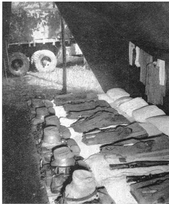
Plankenordnung der Pzj.Rep.Kp.

Die Kaderausbildung ist normal. Die Zugführer der Reparaturzüge werden nach Zivilberuf und Eignung