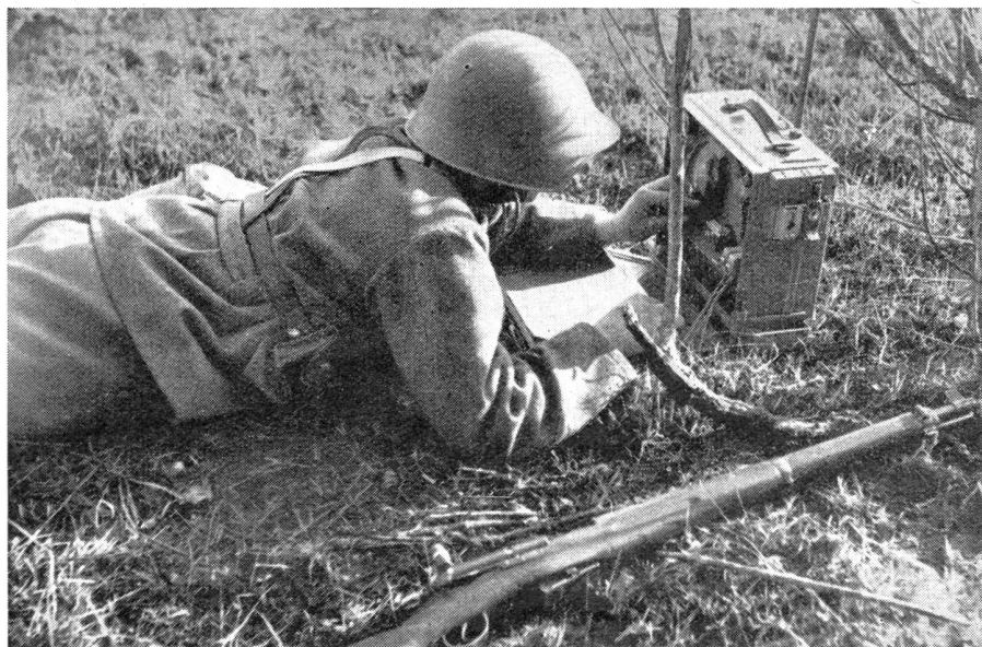
Das erste Patr.-Funkgerät der schweiz. Infanterie (1939 an der Landi).

Wie waren nun aber die Bedingungen, welche die Truppe stellte?