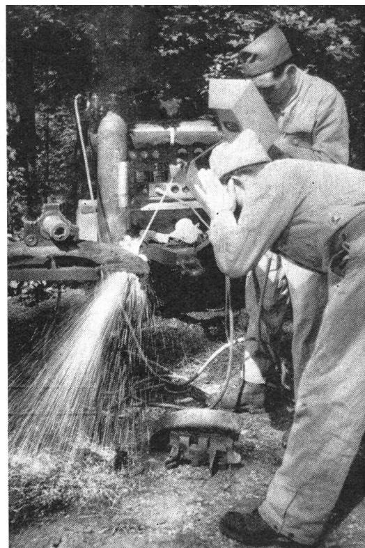
Die Elektroschweißanlage wird auf einem Anhänger des Werkstattwagens mitgeführt.

groß ist und sich auch die enge Bauart anfällig auswirkt. Die übrigen Motorfahrzeuge der Armee können im Notfall immer in einer Werkstatt repariert werden; für Spezialfahrzeuge, wie unsere Panzerjäger, braucht es besondere Mittel.