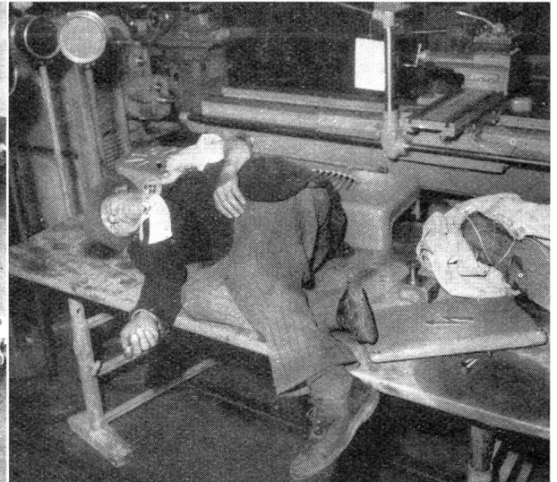
Ein Verwundeter erwartet in der Fabrikhalle Nr.155 den Abtransport in die Sanitäts-Hilfsstelle.

Grade anerkannt wird. Gestützt auf die Erfahrungen der ersten beiden Jahre wurden die Wettkampfbedingungen dahin abgeändert — Weisungen der Gruppe für Ausbildung vom 4. 5. 1950 —, daß die erzielten Leistungen auf den in den Lauf eingelegten militärischen Prüfungen, eine bessere, sich der Wertung der Laufzeit nähernde Bewertung erfahren.