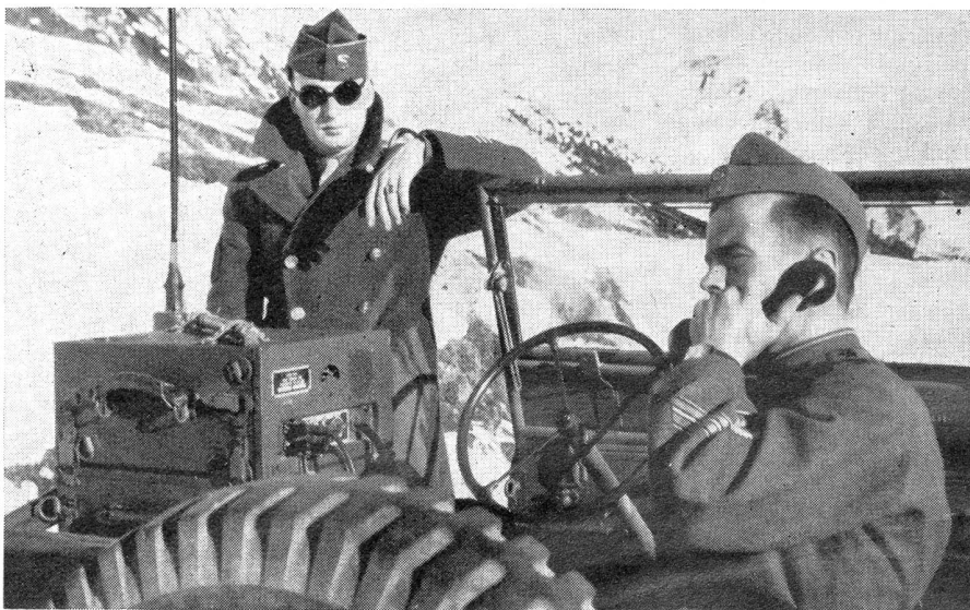
Amerikanische Kleinfunksta. auf Jeep als ständiger Begleiter des Bat.Kdt.

Im gleichen Sinne beschreibt S. A. Kovpak im Buch «Les partisans soviétiques» das Leben der russischen Partisanen weit hinter den deutschen Linien. Jene erhielten ihre Aufträge monatlang durch Fk., so daß sie rechtzeitig und an richtiger Stelle die Nachschublinien der Deutschen unterbrechen konnten. Ira Wolfert schreibt im Buch «American Guerilla», wie einzig die Kleinfunksta. noch gestattete, die zerstreuten Guerilla-Gruppen auf den Philippinen erfolgreich gegen die Japaner führen zu können. Wolfert