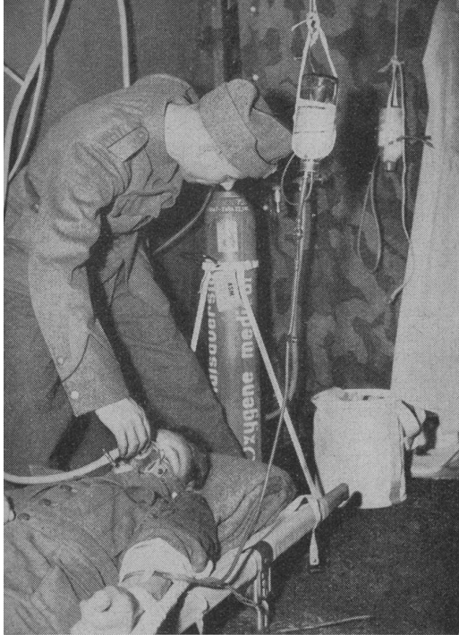
Bluttransfusion und Sauerstoffversorgung im Operationsraum eines Sanitätszuges.

tärsanitätsdienst Tatsache wurden. Er wird in Zukunft 31 000 Mann rekrutiertes Sanitätspersonal und 16 000 freiwillige Helfer umfassen. Dem Inf.Feldbataillon wurde neu ein dritter Arzt zugewiesen, währenddem die Sanitätsmannschaft um vier Mann geschwächt wurde. Ein gewisser Ausgleich findet dadurch statt, daß sämtliche Spielleute dem Sanitätsdienst als Gehilfen zur Verfügung stehen und in der Rekrutenschule eine entsprechende 80stündige Ausbildung erhalten. Für den Regimentsarzt vermehrt sich damit das Personal um 2 Uof. und 46 gut ausgebildete Sanitätsgehilfen. Jede Division verfügt über eine Sanitätsabteilung, bestehend aus Stab, Stabs-Kp., 3 San.Kp. und einer chirurgischen Ambulanz. Jede Geb.Br. über eine gleiche Abteilung, jedoch nur mit 2 Kp. Die Sanitätsformation des Armeekorps umfaßt neu eine Landwehr-Sanitätsabteilung, bestehend aus Stab, Stabs-Kp., 2 San.Kp., 2 chirurgischen Ambulanzen und einer Sanitätstransportkolonne. Schon die San.Kp. besitzt heute eigene Verwundetentransportmittel. Letztere sind, entsprechend den Kriegserfahrungen, ganz neu aufgeteilt, mit entsprechenden Reserven bei der Hee-