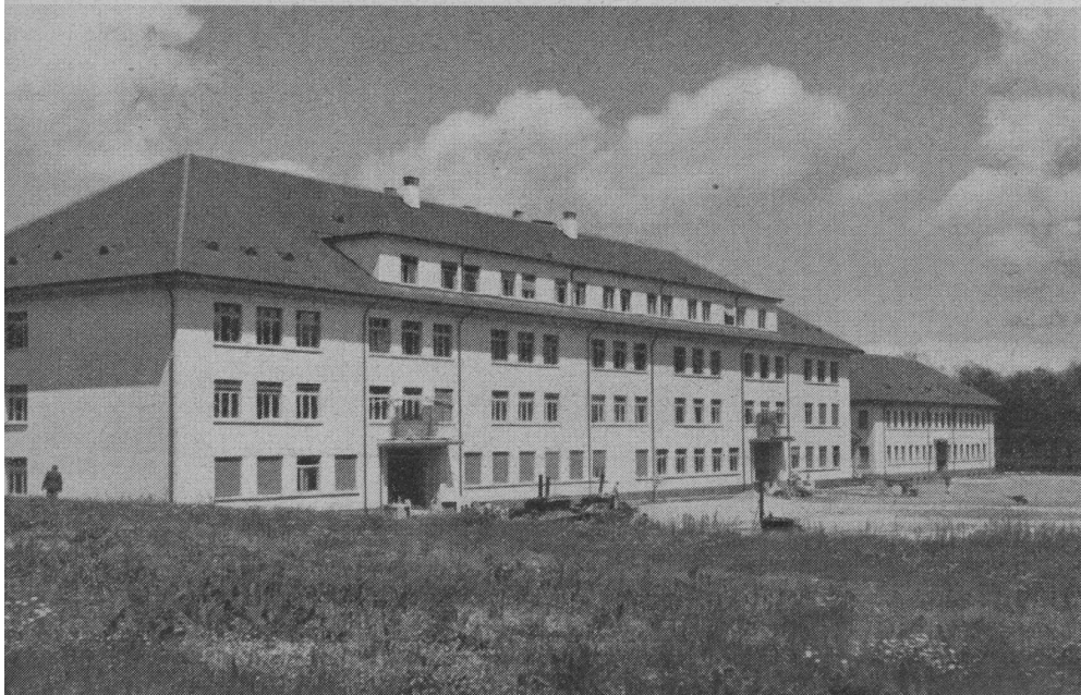
Teilansicht der neuen Kaserne «La Poya» der Inf.-Uebermittlungstruppen in Freiburg.

An der feierlichen Uebergabe der neuen Kaserne (siehe Bild) unterstrich Herr Bundesrat Kobelt den Wert der Rekr.-Schulen als militärische Ausbildungs- und Erziehungsinstitution. Angesichts der kurzen Ausbildungszeit müssen wir heute vom Rekruten sehr viel verlangen. Es ist daher auch notwendig, daß er sich in der Freizeit in der Kaserne wohl fühlt. Der bundesrätliche Sprecher hob hervor, daß Freiburg heute die schönste Kaserne der Schweiz besitze. Die Kaserne «La Poya» liegt im Norden der alten Zähringer-Stadt unweit des Universitäts-Sportplatzes St-Léonard an der Kantonsstraße Freiburg—Murten. Ein wahrer Zufall will es, daß die neue Kaserne gerade an die Straße zu stehen kommt, wo der Läufer mit dem Lindenzweig vom Schlachtfeld von Murten die Siegesbotschaft nach Freiburg überbrachte. --er.