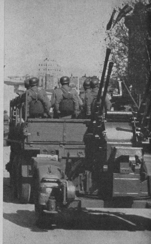
20 - mm - Fliegerabwehr - Vierlings - Geschütz deutscher Konstruktion.

Aus der erwähnten Schrift geht ganz eindeutig auch die Bedeutung hervor, welche dem Partisanenkrieg und den Kämpfern der Jahre 1941 bis 1945 heute noch zukommt. Bei der Auswahl und Beförderung der Offiziere der Armee waren in erster Linie die Qualifikation als Partisanenkämpfer maßgebend. Wie von verschiedener Seite zu vernehmen war, soll sich die Ausbildung des Heeres immer noch stark an die Erfahrungen des Partisanenkrieges anlehnen.