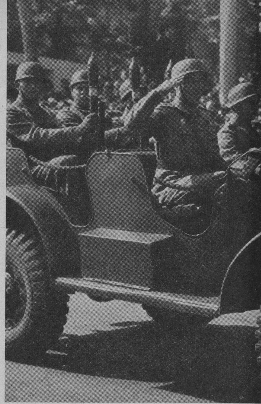
Motorisierte Granatwerfergruppe einer Inf.-Abteilung. Bei den im Wagen sichtbaren Waffen handelt es sich um ein Granatwerfer-Gewehr jugoslawischer Konstruktion mit einem Kaliber von etwa 60 mm, das Spreng- und Hohlgeschosse verschießen kann. Die Waffe und ihre Wirkung ist im Westen fast unbekannt.

Von verschiedenen Seiten war zu erfahren, daß zurzeit in Bosnien, dem eigentlichen Réduit der Partisanenkämpfe, große militärische Bauten vorgenommen werden. Von offizieller Seite wurde dem Berichterstatter