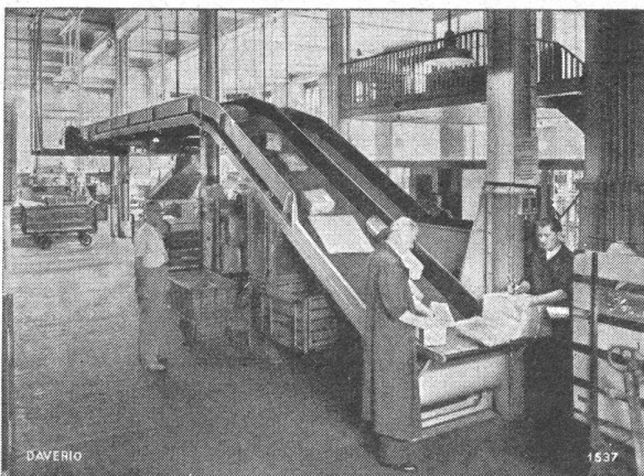
Teilansicht einer Paketförderanlage

Transport-Anlagen Getreide-Mühlen Getreide-, Malz- und Kohlen-Silos Brech- und Sortieranlagen für Kohle und Koks Kesselbeschickungsanlagen Ölwalzwerke, Schlagmühlen