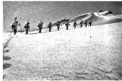
Wintergebirgskurs einer Heeresinheit: Geb.Patr. im Anstieg.

Instruktionen über die Rettung Verunfallter in Fels und Eis und vor allem die Bergung in Gletscherspalten eingestürzter Leute, erste Hilfeleistung bei Verletzungen, Biwakieren und Abkochen unter erschwerten Verhältnissen und in jeder Situation gehören ins Ausbildungsprogramm unserer Truppe im Hochgebirge. Jederzeit überlegt und selbständig handeln können ist das, was man von jedem Gebirgssoldaten verlangen muß. Ueber die Grundbegriffe der Hygiene muß jeder durch Arzt und Kdt. aufgeklärt werden. Ein tägliches kurzes Fußbad auch in kaltem Wasser verhindert Fußkrankheiten und erhält die Marschtüchtigkeit. Auch für die Pferde ist ein kurzes Fußbad im Bergbach eine Wohltat. Rasieren kann man sich auch mit kaltem Was-