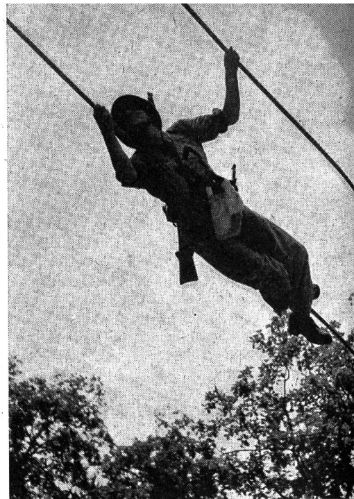
Hindernislauf. Hangeln am Seil.

Diesem weihevollen Festakt und der Uebernahme der neuen Fahne, die mit Recht ein strahlendes Feldzeichen genannt werden kann, schloß sich ein gediegener Empfang durch die Bieler Behörden im Foyer des alten Zeughauses an. Aus dem Kranz der Reden sei besonders die General Guisans hervorgehoben, der sich in jugendlicher Frische und