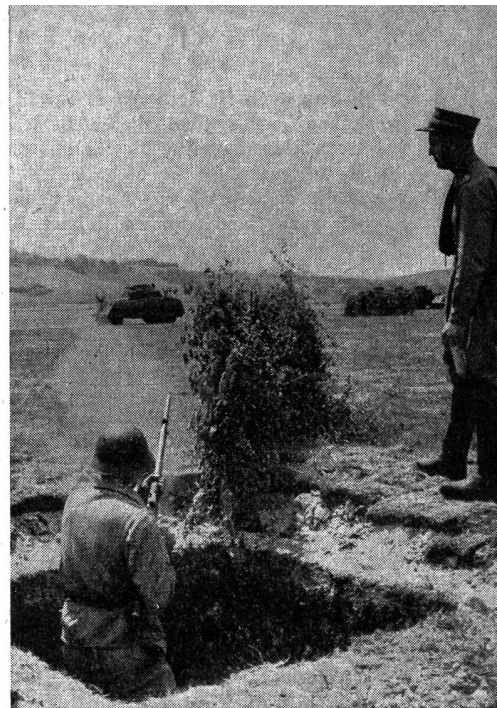
Uebung mit Panzerfaust.

Ein weitere wichtige Aufgabe, der wir unsere volle Beachtung schenken müssen, bilden die Maßnahmen zum Schutze der Zivilbevölkerung vor den Folgen des Krieges, des Luftkrieges im besondern. Wohl hat die Armee eine Luftschutztruppe geschaffen und in Verbindung mit den zivilen Behörden Vorbereitungen für die Brandbekämpfung getroffen. Aber diese Maßnahmen sind wenig wirksam, wenn nicht genügend Schutzräume für die Zivilbevölkerung in den Häusern größerer und geschlossener Siedlungen erstellt werden. Leider scheinen sich aber auch hier, wie bei der Finanzierung des Rüstungspro-