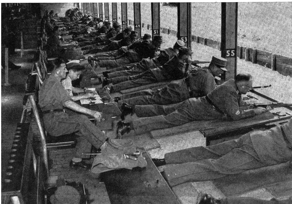
Wettkampf im Schießen.

Der Sonntag brachte mit den Gottesdiensten beider Konfessionen, dem Festzug durch die reichen Flaggen schmuck tragenden Straßen der Seeländer Metropole und dem vaterländischen Weiheakt im Stadion Gurzelen den Höhepunkt der SUT 1952. Der Berichterstatter hat einige Stimmen vernommen, die den Festzug als zu lang, zu pompös und als unnötig bezeichneten. Auch gab das Anstehen und die zeitraubende Ordnung des Festzuges zu Bemerkungen Anlaß. Der Berichterstatter hat den Festzug zweimal an sich vorbeiziehen lassen, das erste Mal kurz nach dem Abmarsch und das zweite Mal auf der Höhe der Ehrentribüne. Dieser Festzug, der einmal zu den SUT gehört, machte in seiner gut gewählten Gliederung, angeführt von der Bieler und Militär-Straßenpolizei und den Geschützen des Artillerievereins, einen ausgezeichneten, strammen und geschlossenen Eindruck. Sinnfällig kam den Ehrengästen wie den Abertausenden der Zuschauer, die in dichten Reihen die Straßen säumten, die geballte Kraft, die Wucht des zielstrebigem Wollens des Schweizerischen Unter-