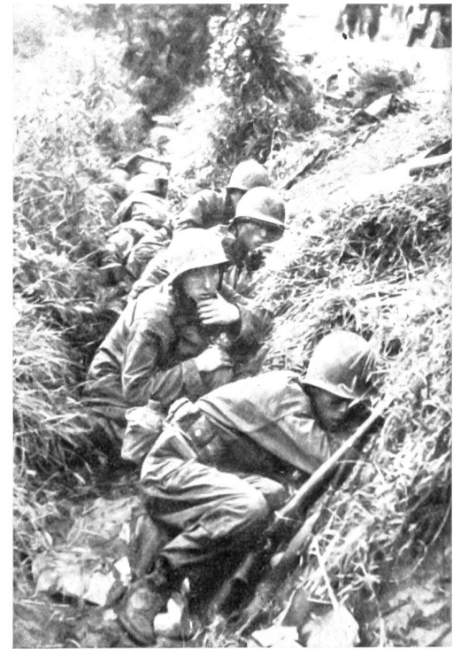
Infanteristen suchen während eines feindlichen Feuerüberfalles in einem Straßengraben Deckung.

Unter den politisch-strategischen Erkenntnissen des koreanischen Krieges steht im Vordergrund die alte Weisheit, daß ein Krieg provoziert werden kann durch die Schwäche des Angegriffenen. Die ungenügende militärische Bereitschaft Südkoreas und die unzulänglichen, in Japan stehenden amerikanischen Besatzungstruppen mußten für die Nordkoreaner und ihre Hintermänner geradezu eine Einladung bedeuten, ihre Hand nach dem Süden auszustrecken. Der nordkoreanische Angriff ist als strategischer Ueberfall ausgelöst worden, der hinter der hermetischen Abschirmung durch einen Eisernen Vorhang in allen Einzelheiten vorbereitet worden ist. Diese Kriegsvorbereitungen, die wir in ihrer Gesamtheit als den «kalten Krieg» bezeichnen, haben