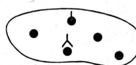
= Lmg. Equipe mit Gruppenführer