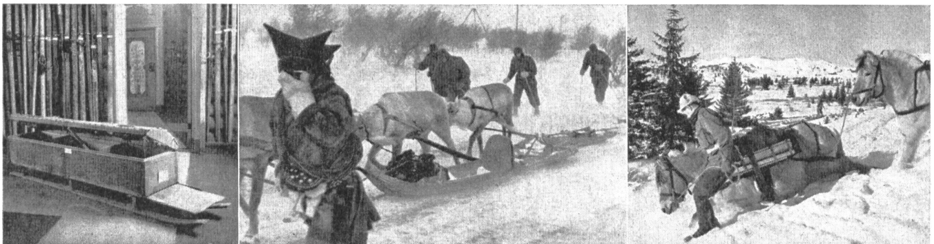
Von links nach rechts:

Die erwähnte Kampfration enthält Hartbrot, Keks, Würfelzucker, eine Konserve als Hauptmahlzeit, Kochschokolade, eine Suppenkonserve, Kakao, Haferflocken, Kaffeepulver, einen Büchsenöffner, einen kleinen Löffel, Zündhölzer, eine Papierserviette und Brennstoffwürfel. Die Ration ist in eine Schachtel mit abgerundeten Ecken verpackt. Ein Dutzend dieser Schachteln findet in einem Karton Platz, der mit einem besonderen Material imprägniert ist, der die Verpflegungsartikel gegen radioaktive Strahlen schützt. Die Kampfration enthält 3800 Kalorien.