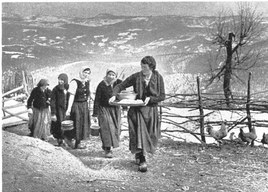
Frauen aus den benachbarten Dörfern verpflegen Partisaneneinheiten ihrer Gegend in Herzegowina. Frühjahr 1942.