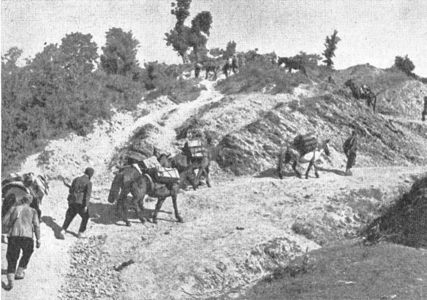
Eine Verpflegungskolonne der Partisaneneinheiten. Crna Gora. Montenegro 1943.