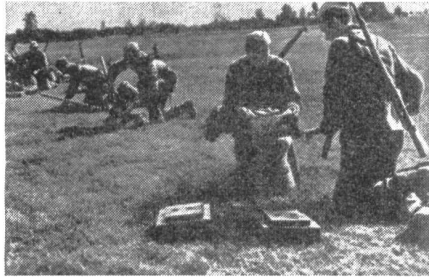
Jugoslawische Truppen beim Legen einer Minensperre. Deutlich ist der Tarntrupp an der Arbeit zu erkennen, der in Säcken die ausgegrabene Erde sammelt und wegführt.

Der Berichterstatter hat zur besonderen Information eine Blitzreise durch Jugoslawien gestartet, die innert 12 Tagen durch Slowenien, durch Kroatien bis an die Adria, im Auto durch Bosnien und die Herzegowina nach Sarajevo, nach Belgrad und Zagreb führte. Im Gespräch mit der Bevölkerung, mit führenden Politikern, Offizieren und Journalisten ergab sich die Möglichkeit, beste Informationen zum leider immer noch aktuellen Triestinerproblem und über die russische Haltung gegenüber dem Westen zu sammeln und zu einem Gesamtbild zu verarbeiten. Wenn jemand in Europa das Verhalten und die Reaktionen der führenden Leute im Mos-