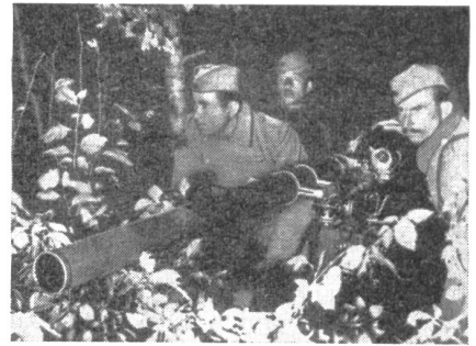
Die jugoslawischen Truppen vor Triest sind mit modernsten amerikanischen Waffen versehen. Unser Bild zeigt eine rückstoßfreie Panzerabwehrkanone in Feuerstellung.

Zum Problem Triest können wir uns kurz halten. Auffallend ist die Ruhe und Besonnenheit, mit der heute in Jugoslawien dieses Problem behandelt wird. Zwischen Regierung und Volk besteht gerade in dieser Frage völlige Übereinstimmung. Man hütet sich, eine Verschärfung des Konfliktes zu provozieren und den Bogen zu überspannen. Belgrad vertraut auf sein gutes Recht und auf die Stärke der Armee. Die Jugoslawen sind bereit, Italien Stadt und Hafen von Triest zu überlassen, die durch die zielstrebige Infiltration der letzten 35 Jahre zu einer italienischen Stadt geworden sind. Nicht verzichten will man aber auf das heute noch durch Slowenen besiedelte Hinterland von Triest, die man auf Grund der mit Italien gemachten schlechten Erfahrungen — siehe auch Südtirol — nicht der italienischen Verwaltung unterstellen möchte. Jugoslawien wäre auch bereit, Italien einen Korridor durch slowenisches Gebiet einzuräumen, damit die Stadt Triest nicht zu einer isolierten Enklave wird. Jugoslawien läßt auch über die Abtretung der kleinen italienischen Küstenstädte der B-Zone mit sich reden, wenn Italien zu einer vernünftigen Grenzziehung im Raume von Goriza Hand bietet, wo die Grenze heute mitten