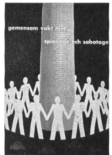
Gemeinsame Wacht gegen Spionage und Sabotage.