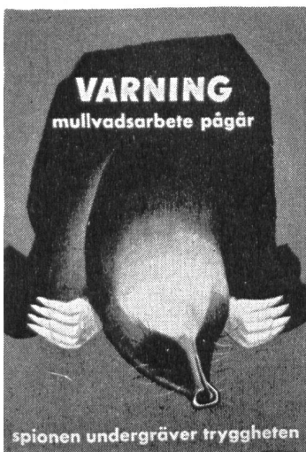
Achtung! Maulwurfsarbeiten im Gange. Demaskiere Spione und Saboteure! Spione untergraben die Sicherheit!

Die Vereinigung «Volk och Försvar» (Volk und Verteidigung), die, aus allen Schichten und Kreisen zusammengesetzt, sich in Schweden um die Aufklärung der Bevölkerung und die Unterstützung der Landesverteidigung verdient macht, hat eine Reihe eindringlicher Plakate drucken und verteilen lassen, die sich mit der Abwehr von Spionage und Sabotage befassen. Unser Bild zeigt eine Serie von vier Plakaten, die folgende Texte tragen: