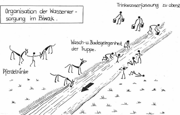
Organisation der Wasserversorgung im Biwak.