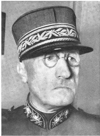
Oberstkorpskommandant Prisi †

Dieser Beschluß wird nach dem vom englischen Verteidigungsminister dem Unterhaus übermittelten Bericht weitreichende Auswirkungen auf die Verteidigungspolitik haben. Die Gewalt der Wasserstoffwaffen sei so groß, daß die Genauigkeit eines Bombardements aus der Luft von seiner Bedeutung verliere. Daher können Angriffe durch Flugzeuge in sehr großer Höhe und bei hoher Geschwindigkeit geführt werden. Zu diesem Zwecke soll eine moderne strategische Luftwaffe ausgebaut werden. Ueber die Auswirkungen der Wasserstoffwaffen sagt das Weißbuch: «Wenn solche Waffen verwendet werden sollten, so würden sie Menschen und Material in bisher nicht gekanntem Ausmaß zerstören. Eine in der Luft zur Detonation gebrachte H-Bombe würde ein weites Gebiet durch die Explosion und die Wärmestrahlung verwüsten. Bei einer Explosion auf der Erdoberfläche wären Detonationswirkungen und Hitze etwas geringer, aber es würden sich zusätzliche, sehr ernste Auswirkungen ergeben. Eine große Menge atomischer Teilchen würden in die Luft gesogen werden. Viel davon würde jedoch davongetragen und als radioaktiver ‚Ausfall‘ niedergehen. Die Wirkung auf die ohne Schutz im Gebiet der größten Konzentration des ‚Ausfalls‘ betroffenen Personen wäre tödlich. Ein grimmiger Kampf ums nackte Leben würde sich abspielen. Diese Tatsachen sollten nicht nur dem britischen Volke, sondern der ganzen Welt bekannt sein.»