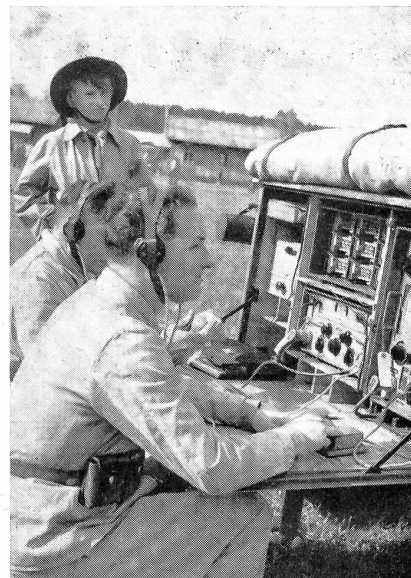
Tag der Uebermittlungstruppen in Dübendorf. Aus dem Gruppenwettkampf für Stationsmannschaften. ATP

Wir möchten aber an dieser Stelle einmal mehr festhalten, daß die einzige Chance, den Frieden zu bewahren, heute in der Einigkeit und der wachsenden militärischen Stärke des Westens liegt. Die Sowjets achten nichts mehr als die Macht und die unnachgiebige Entschlossenheit eines unter sich einigen Verhandlungspartners. Das Nachgeben der Russen gegenüber Oesterreich und der endliche Staatsvertrag gehen schlußendlich auf die wachsende Stärke und die einige, alle faulen Kompromisse ablehnende Politik des Westens zurück. Ohne NATO und ohne ratifizierte Pariser Verträge hätte es noch keine Freiheit Oester-