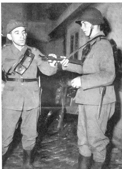
Aus einer Radfahrer-Rekrutenschule «Wie geht's?» Fürsorglich erkundigt sich der Gruppenführer nach dem Zustand seiner Leute und ihrer Ausrüstung.

Suisse nennt. Hindernisse besonderer Art stellen sich hier den Rekruten in den Weg: Gemächlich ziehen größere und kleinere Kuhherden auf die Weideplätze zu Füßen des Gonzen und Alvier hinaus. Nach Sargans wird der Wind zum willkommenen Verbündeten und stößt die allmählich ermüdeten «Giganten im feldgrauen Dreß» gegen Landquart hinauf, ans Tor des Prättigaus. Noch 30 Kilometer und 700 Meter Höhendifferenz sind zu überwinden. Fast bricht die Sonne durch die gelichtete Wolkendecke. In forschem Tempo eilen die Fahrer nach aufwärts. Doch bleibt der gefürchtete Stich zwischen Küblis und Saas. Die «Bergspezialisten» wetzen ihre Klingen. Dann heißt's aber bald einmal für alle absitzen und «rudern». Gnädig bleibt jetzt die Sonne versteckt. Die Kompanien haben sich wieder gut formiert und fahren mit viertelstündigem Vorsprung auf die Marschtabelle durchs «Etappenziel». Die Rekruten haben die erste große Probe bestanden.