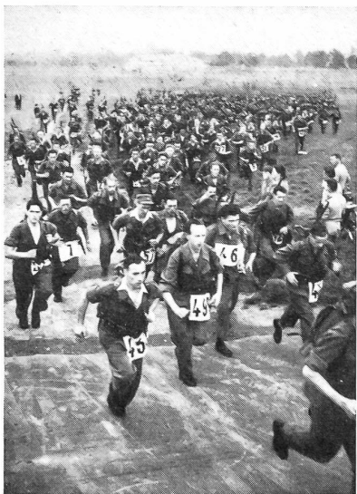
6. Berner Waffenlauf vom 12. 9. 1954 Start der 650 Läufer