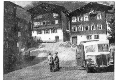
Hier ein Ausschnitt des ehrwürdigen Dorfplatzes von Ernen, einer fortschrittlichen Gemeinde im Oberwallis, von der in unserem Bericht ausführlich die Rede ist.

Dem Sterben der Bergdörfer kann ohne fremde Hilfe kein Einhalt mehr geboten