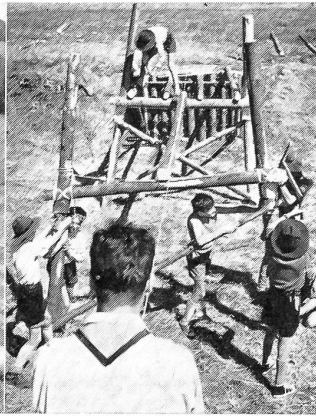
Hier wird allerdings kein Armeematerial verwendet, dafür aber eine Pionierarbeit geleistet, die als vorbildliches Training für spätere Brücken- und Notstege in WK und Manövern dienen kann.