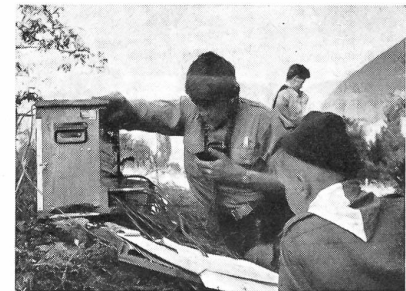
Auch im Gelände hatte man Telephonzentralen der Armee aufgestellt — unermüdlich telephonierte die Pfadi dem Gefechtsdraht entlang und meldeten ihre Wahrnehmungen.

Im Uebermittlungslager waren die Armeetf-Zentralen, Einzelapparate und auch die drahtlosen Fox- und TL-Geräte Trumpf. Mit welchem Eifer die Pfader sich in die technischen Belange einführen ließen und mit welchem Interesse sie mit dem Armeematerial und den Armeegeräten umgingen, zeigt unsere Bilderserie. H. F.