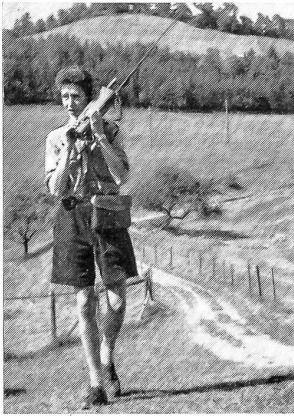
Auch gefunkt wurde im Relaislager: die Foxgeräte wie auch die tragbaren TL-Geräte wurden von den Pfadfindern mit Begeisterung bedient und zu abenteuerlichen Spielen verwendet.