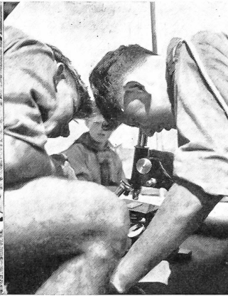
Nicht nur die Armee, auch die Universität macht mit: Zuhilfenahme des Lagers für Naturkunde und Beobachtung lieh die Universität Neuenburg regelrechte Mikroskope.