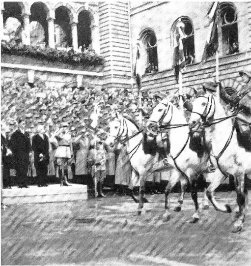
Fahnen Ehrung in Bern, 20. Aug. 1945. Der General sprach: «Euer General tritt ins Glied zurück, aber die Armee bleibt in Bereitschaft, und das ist es, was zählt.»

Tatsache ist aber vielleicht noch mehr als bloßer Ausdruck der Sympathie für die Volksverbundenheit, die Tüchtigkeit und das Ansehen des ersten Soldaten, es bedeutet auch Dankbarkeit an den General und ist zugleich ein Symbol jedes einzelnen Offiziers, Unteroffiziers und Soldaten, der mutig, ruhig und treu während sechs Jahren seine Pflicht der Heimat gegenüber erfüllt hat. Das Bild des Generals ist aber auch ein Zeichen der Einheit und Geschlossenheit unserer Armee während des vergangenen Aktivdienstes und sprechender Zeuge der Verbundenheit zwischen Volk und Armee. Möge das Bild des Generals dem Schweizervolke eine stete Mahnung zur Eintracht, zur Treue und Hingabe an das Vaterland sein. General Guisan wird aber mit einem warmen Glanz in die Schweizergeschichte eingehen. «Il a mérité sa patrie — Er hat sich um das Vaterland verdient gemacht.»