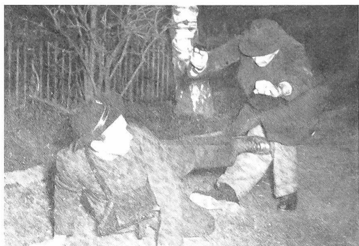
Abwehr gegen Schußwaffenbedrohung von hinten

Das Training des Jiu-Jitsu bis zum sicheren Beherrschen der wichtigsten Vor- und Fallübungen (bei Stürzen Verletzungen verhindernde Falltechnik), Griffe und Schläge erfordert natürlich Zeit. Es ist daher wertvoll, wenn die Armee innerhalb ihrer Nahkampfausbildung regelmäßige und zeitlich nicht zu knappe Jiu-Jitsu-Kurse abhalten läßt. Von den Staaten, welche ein Jiu-Jitsu-Training wenigstens für Spezialeinheiten bereits eingeführt und im Kriege erprobt haben, sind vor allem Japan und Großbritannien zu nennen. In der japanischen Armee wurde die Ausbildung im Jiu-Jitsu in umfangreichem Maße durchgeführt und mit Erfolg im Chinakrieg, sowie bei den Dschungelkämpfen auf der Halbinsel Ma-