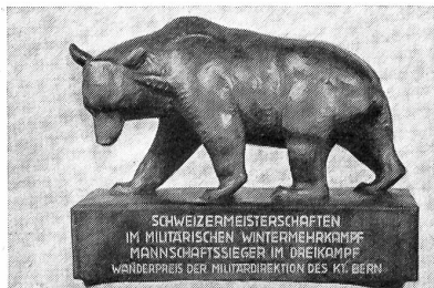
Der originelle Wanderpreis der Berner Militärdirektion, der dieses Jahr vom gegenwärtigen Besitzer, den Grenzwächtern, hart verteidigt werden dürfte.