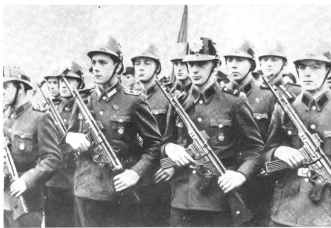
nahme aus Leipzig. Nach dem Polizeiaufwand und ihrer Ausrüstung in der Sowjetzone könnte man annehmen, daß die Bevölkerung vorwiegend aus Verbrechern und kriminellen Elementen besteht. Dieser Aufwand ist aber notwendig, um ein unzufriedenes Volk in Schach zu halten und eine dem Lande von außen her aufgezwungene Regierung und ihren Zwangsapparat zu schützen.

Mit automatischen Waffen ausgerüstete Bereitschaftseinheit der Volkspolizei im sowjetisch besetzten Raum Mitteldeutschlands. Auf-