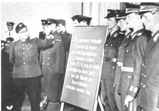
Ausstellung der Uniformen der «Nationalen Volksarmee» in Ostberlin. Besonders ausgebildete Führer orientieren die Besucher und führen sie auch vor die überall aufgestellten Propagandatafeln.

schen Initiative der Menschheit zu Hause sind. Der Berichterstatter hat im Flüchtlingslager von Marienfelde, durch das in den letzten Jahren Zehntausende von aus der sowjetischen Besatzungszone Verfolgte und Vertriebene gingen, den Einvernahmen von Flüchtlingen beigewohnt, um sich im Gespräch mit den Betroffenen und sie Einvernehmenden, die selbst einst Flüchtlinge waren, selbst ein zuverlässiges Bild des Lebens in der Ostzone Deutschlands zu machen. Er hat dabei aus dem Munde von jungen Menschen selbst gehört, wie sie in die Parteiformationen, in die «Kasernierte Volkspolizei» und andere Verbände gepreßt