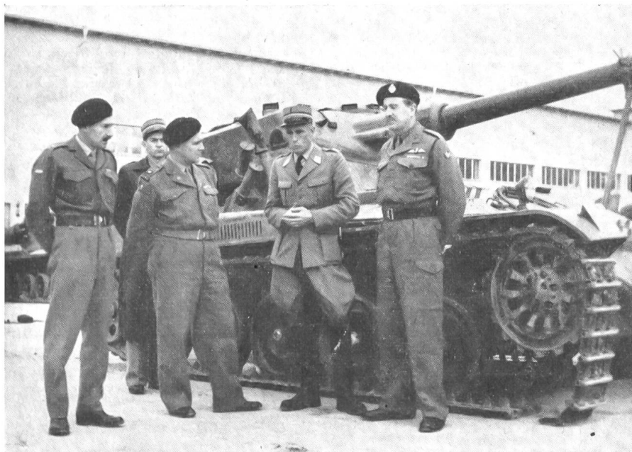
Britische Militärdelegation bei unseren Panzertruppen in Thun

England will von der Ausbildung der Schweizer Panzertruppen lernen.